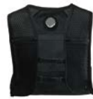
COOLFIX アクティブベスト