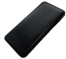
N22-05 モバイルバッテリー10,000mAh