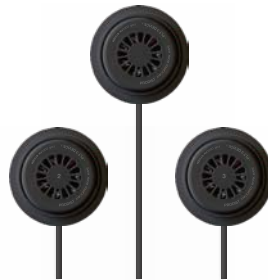
N22-04 COOLFIX PLT3デバイス