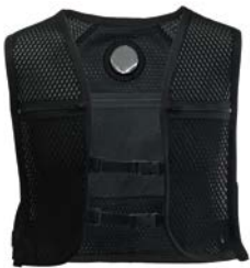
N22-03 COOLFIX アクティブベスト