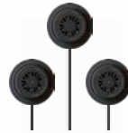
COOLFIX PLT3 デバイス