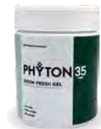
ROOM FRESH GEL

PHYTON35 ルームフレッシュジェル 容器とパッケージをリニューアル しました。