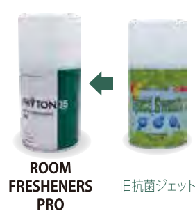
ROOM FRESHENERS PRO 旧抗菌ジェット 旧品の在庫が終わり次第、新パッケージに切り替わります。