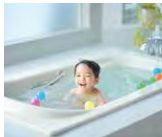
お子様も安心してご入浴いただけます

・バスリキッドを使用すると、洗髪後のフケが少なくなり、肌がつるつるになりました。また、タオルの目に力加が映えなくなりました。 ・顔以外に赤い痒みのある湿疹が出た時に使用しました。1日目で痒みがだいぶ楽になりました。 ・子供は肌が弱く、おじいちゃん、おばあちゃんも入浴するときれいになりました。