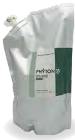
PHYTON35 BATH LIQUID (入浴用アロマリキッド)

PHYTON35「バスリキッド」 ヒノキチオール配合の 入浴用アロマリキッドのご紹介