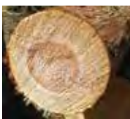
ヒノキの小口イメージ

また、ヒノキチオールの香りを利用したリラクゼーション効果が確かめられており、血圧を整え、ストレスを解消させる効果もありま