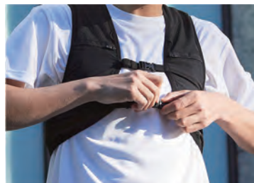
サイズ調整も簡単