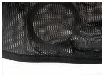
二重構造でリングの落下防止に