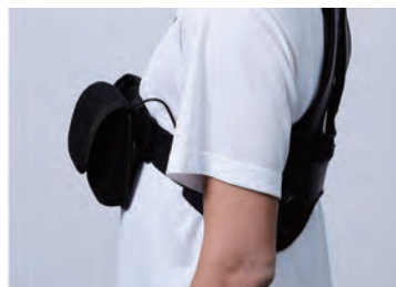
モバイルポケットは前後に装着が可能です