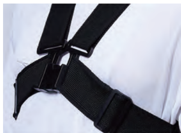
アジャスターと調整ベルトで幅広い体型にフィットします