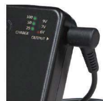
故障しにくい接続部