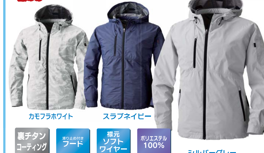
カモフラホワイト